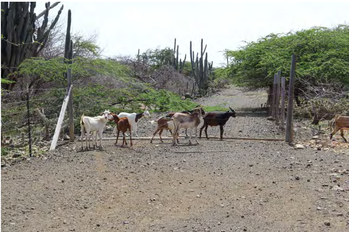
Kunuku met kapot hek