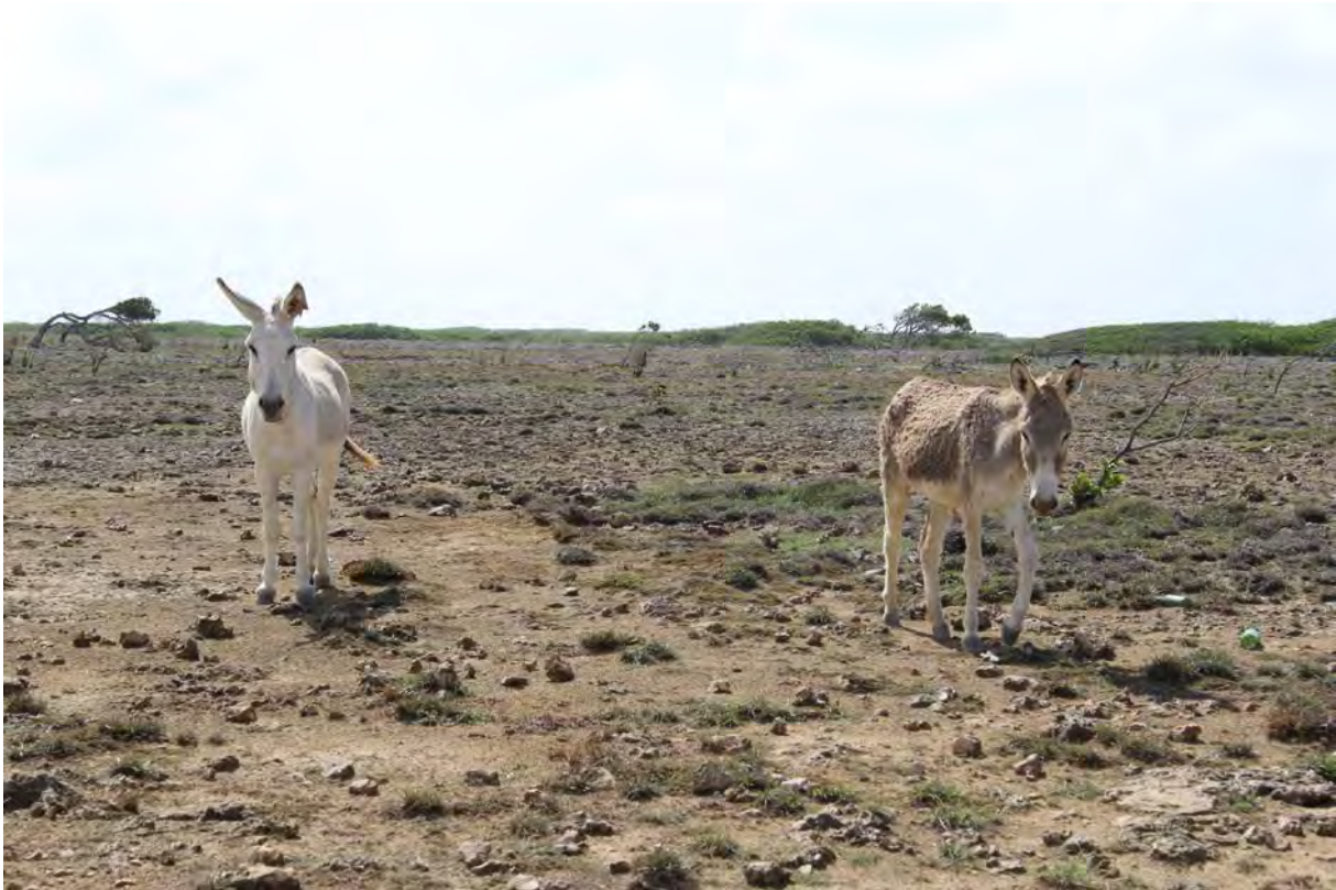
Ook ezels in de kustzone