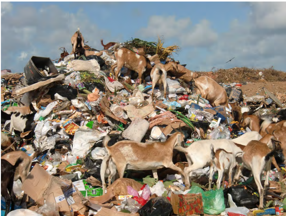
Figuur 5: Gezond geitenvlees

Een zorg van het publiek is dat geiten die op straat lopen ook veel vuilnis eten. Op de vuilnisbelt (landfill) is dat waarschijnlijk een groot probleem (Fig. 1). Sommige restaurants (bv. Chaparal die alleen in het weekend eten serveert) kopen alleen geiten voor de slacht (bij het slachthuis) van betrouwbare bronnen uit schone natuurgebieden zoals Bolivia. Die komen nooit bij de landfill. Maar sommige kuddeën komen regelmatig op de landfill. Selibon is nu bezig om het terrein af te sluiten om te zien of ze het vee weg kunnen houden.