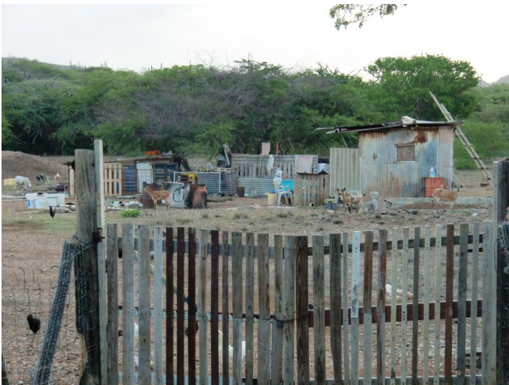
Figuur 19 Voorbeeld van een actief gebruikte kunuku op Bonaire (Debrot)