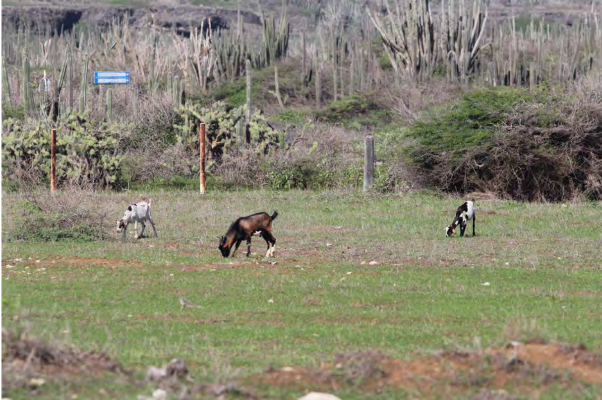
Geiten in een kunuku