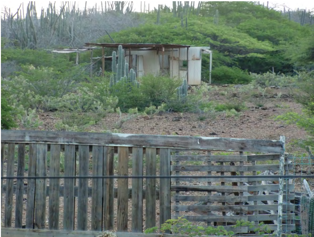
Figuur 18 Zoals de meeste kunukus er heden op Bonaire verlaten bij liggen (Debrot)