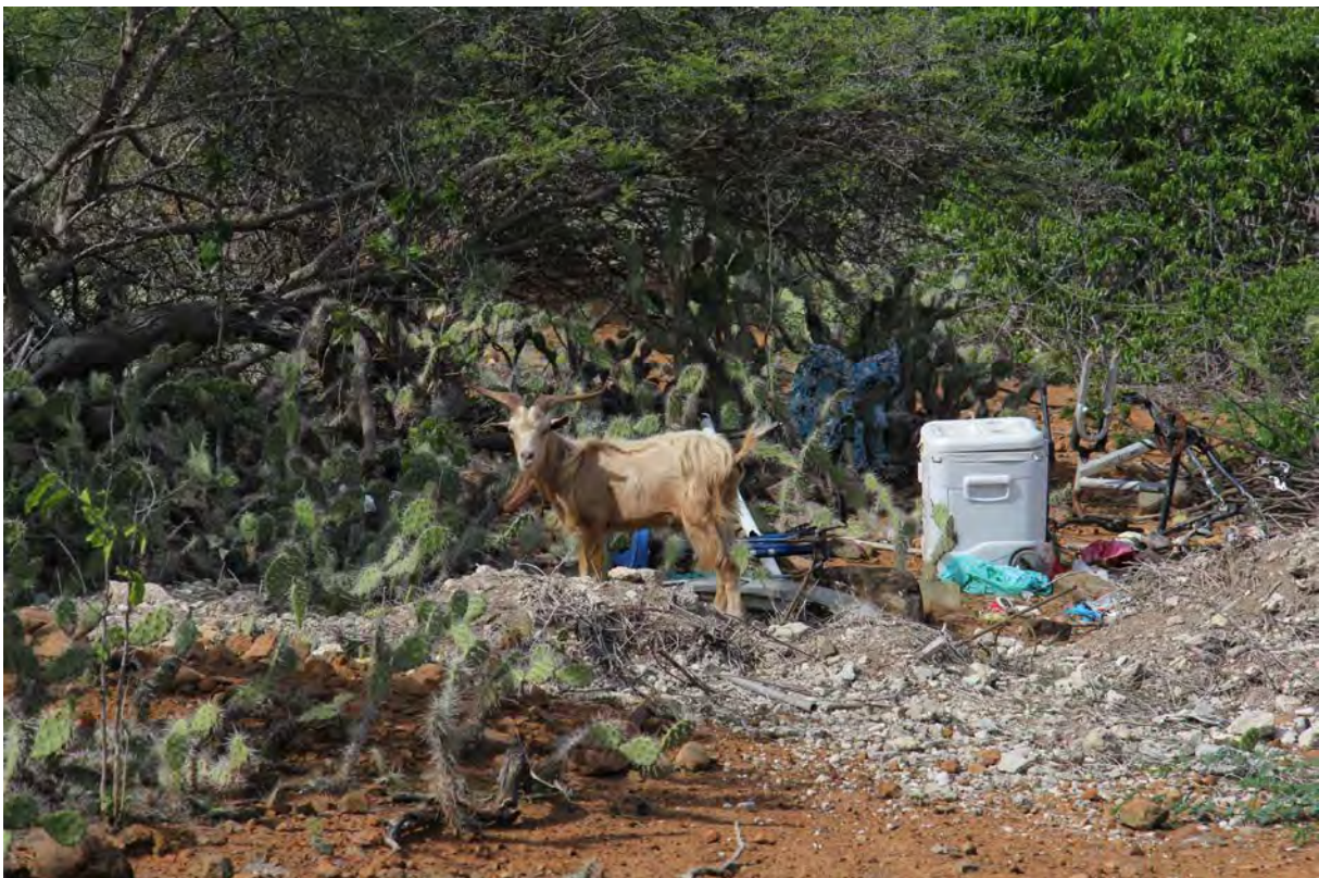
Geiten zitten vaak op de schroothoop