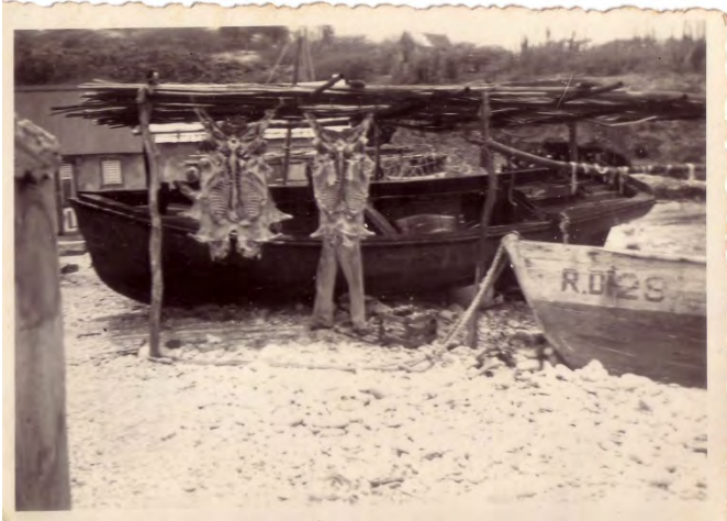
Figuur 2 Zouten van geiten voor 'jorki' (augustus 1948).

talrijker zullen zijn geweest dan geiten, is dat voor de rest van de geschiedenis van Bonaire en tot op