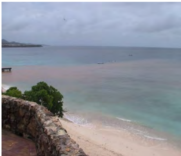
Figuur 6 Voorbeeld van een van de ontelbare modderstromen op het rif na een korte regenbui op Curaçao.

Overbegrazing wordt zo aangewezen als belangrijke oorzaak van stof op het eiland (Nolet and M. 2009). Dit betekent veel werk voor de bewoners en schade aan machines en elektronica. Deze kosten zijn echter nimmer inzichtelijk gemaakt. Overbegrazing en de daardoor veroorzaakte erosie betekenen sediment overlast voor koralen, die daar slecht tegen kunnen. Koralen vormen de basis voor het moderne duiktoerisme en voor de visstand, en leiden ernstig aan de frequente modderstromen en andere bedreigingen waardoor deze cruciale pijler van duiktoerisme en visserij al jaren snel achteruit gaan (Fabricius 2005).