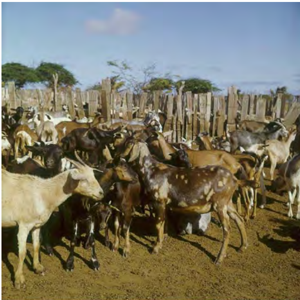
Figuur 12 Geiten in een kraal (Lawson 1964)