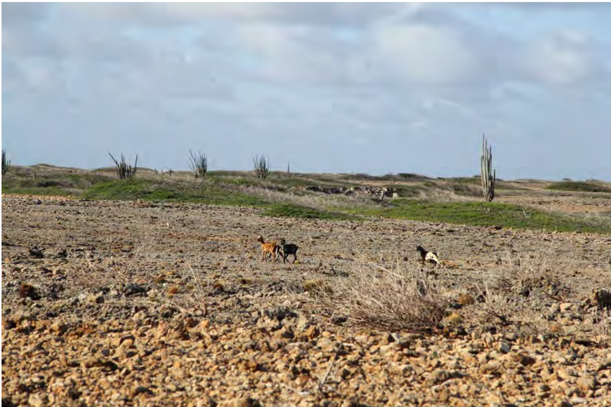
Geiten in de kustzone