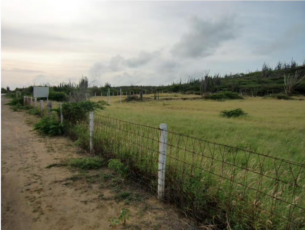
Figuur 16 Beheerde weide van LVV met buffelgrass ( Cenchrus ciliaris ) contrasteert met kale onbeheerde gebieden daarbuiten (Debrot)