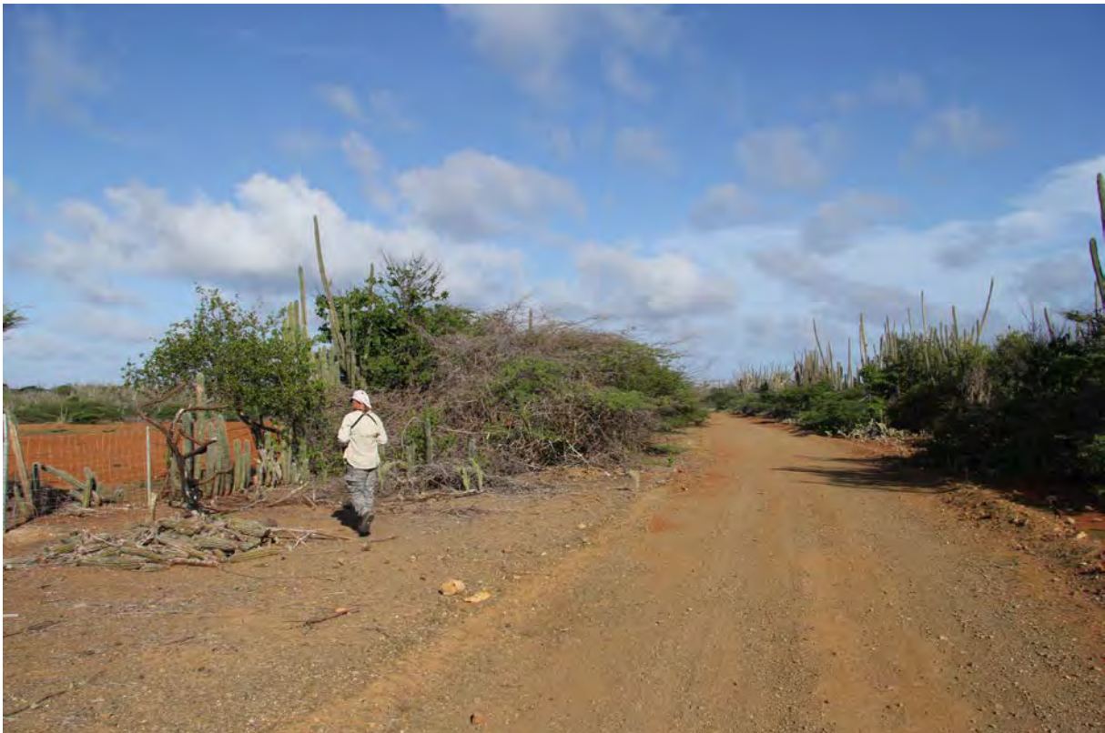
Survey in kunuku gebied