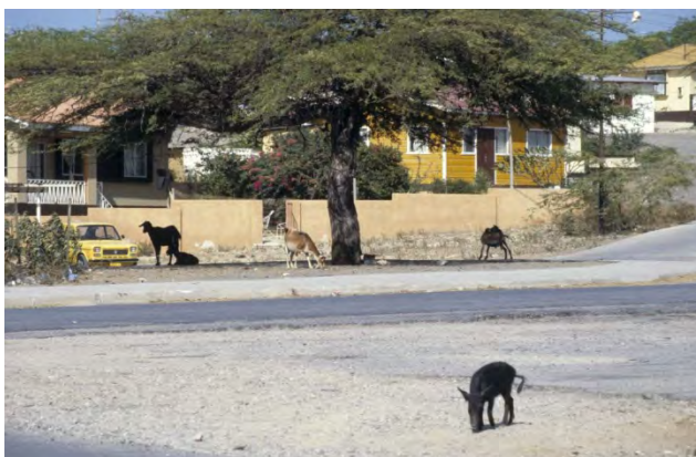
Figuur 10 Gezicht op straat met loslopende geiten (kabrieten) (onbekend)