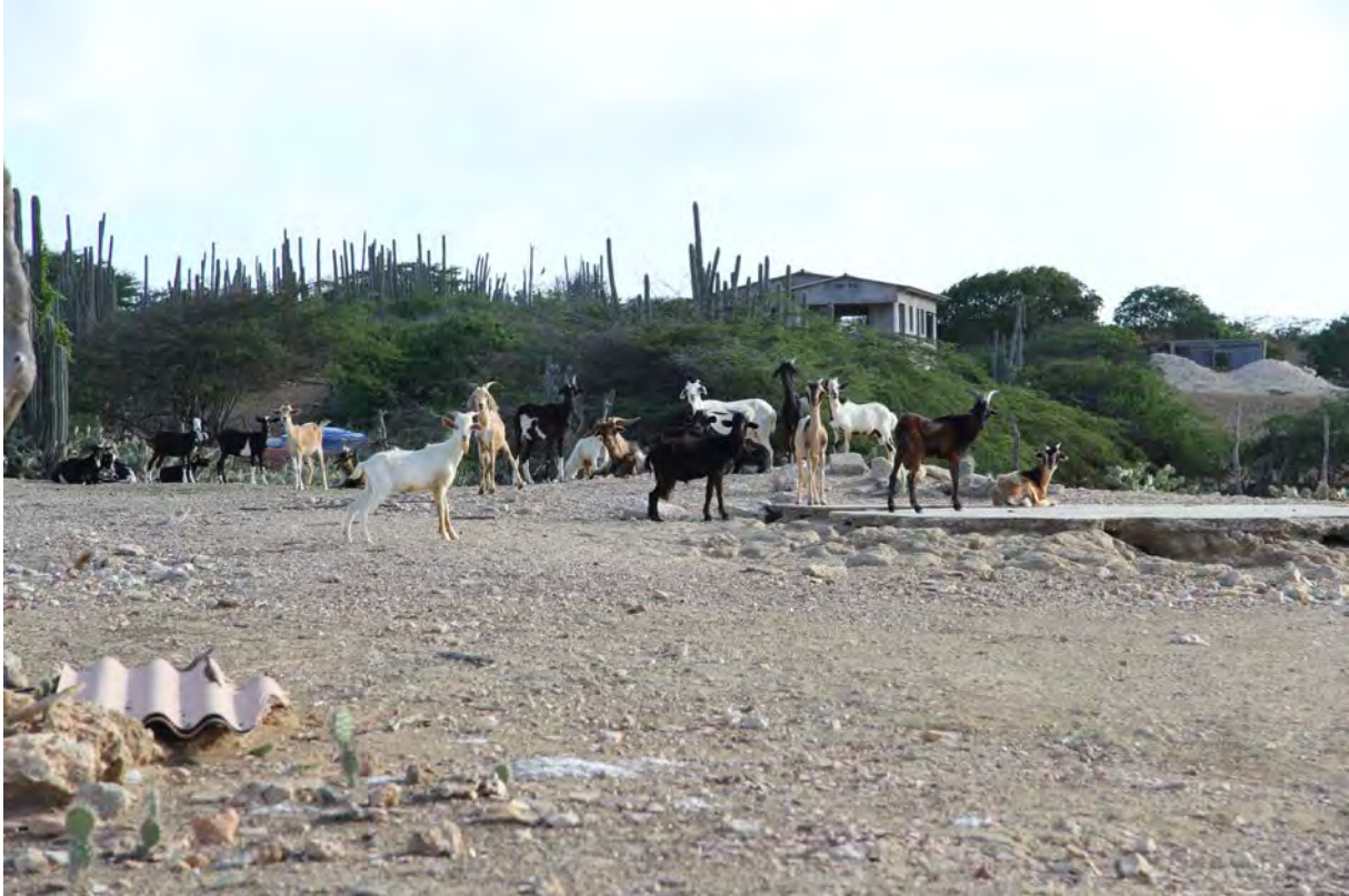
Sommige kunuku's zijn volledig kaal, de geiten moeten wel naar buiten om voldoende voedsel te vinden