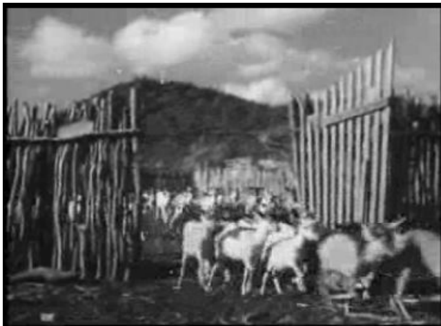
Figuur 14 Geiten in polygoonjournaal (Polygoon Profilti Productie ca. 1950)