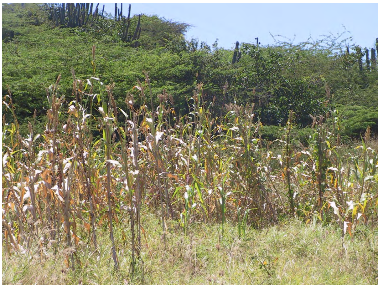
Figuur 4 De belangrijkste voedselgewas in de landbouw op Bonaire, Sorghum vulgare, beter bekend als maishi chiki (kleine mais)

Dat het vrijgeven van veeteelt en agrarisch ondernemen in privéhanden effectieve stimulans was is ook duidelijk uit de beschikbare data voor wat betreft zowel de geschatte stand van de veestapel als ook voor wat de export van veeproducten betreft (Hartog 1957, 281-286). Bonaire vervulde tot medio de 20 ste eeuw zoals nooit tevoren een rol in de agrarische voorziening van het handelscentrum van Curaçao. Playa Frans en Slagbaai werden belangrijke uitvoerhavens van de agrarische productie van de grote noordwestelijke plantages. De privatisering van de agrarische sector leidde weliswaar tot veel hogere productie maar de exploitatie bleef in beginsel gebaseerd op verschillende zeer onduurzame praktijken. De houtkap voor productie van houtskool en ongebluste kalk vond op grote schaal plaats en leidde tot grootschalige ontbossing (Euwens 1907; De Hullu 1923).