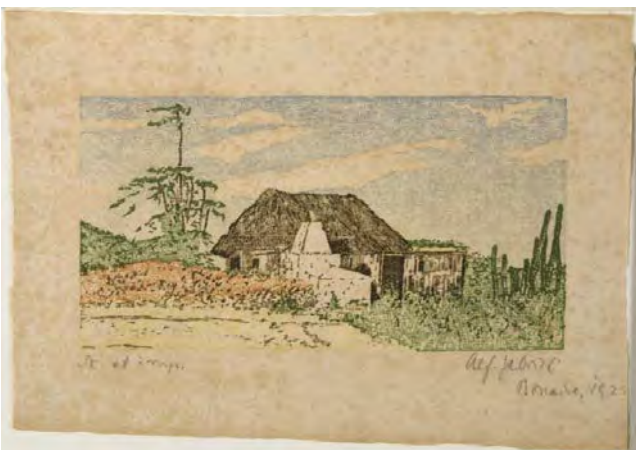
Figuur 13 Hut op een kunuku in 1923 (Gabriel 1923)