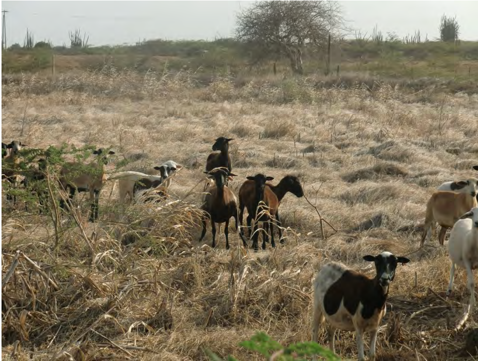
Figuur 8 Er zijn geitenboeren die initiatief tonen door gebruik maken van de door LVV bewezen methodes (weidebeheer, buffelgras) om productiviteit en duurzaamheid van de teelt te verbeteren. Duidelijk weidebeheer op de weg naar Lac. (Photo: A. Debrot, 28 juni 2013)