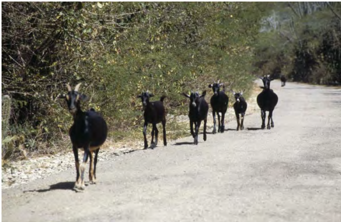
Figuur 11 Geiten op de weg