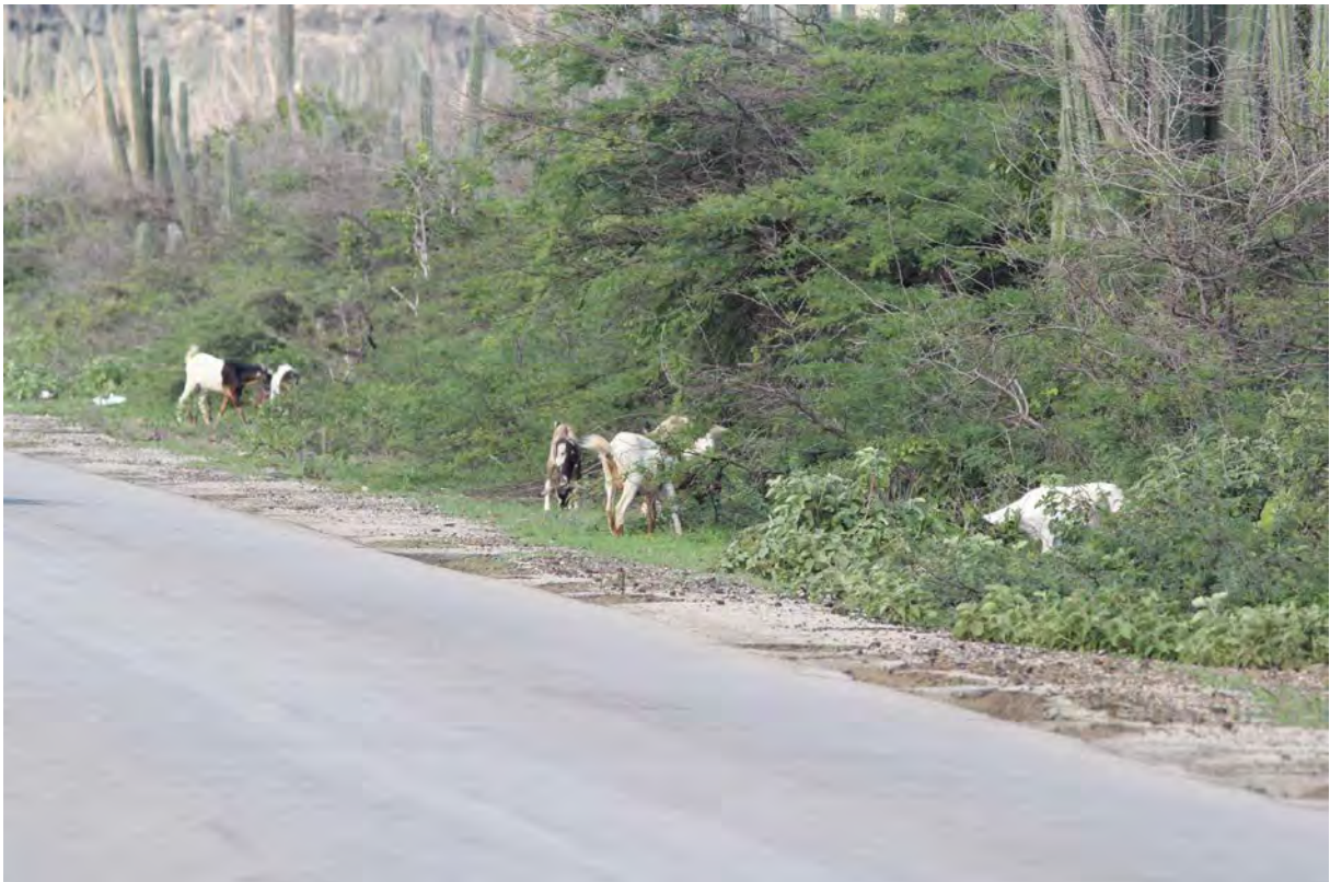
Geiten langs de weg in kunuku gebied