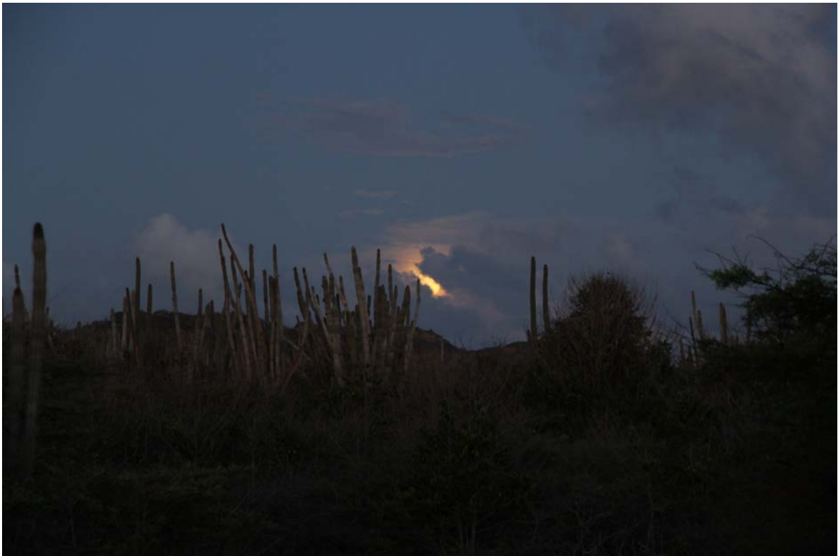
Ochtend in het Washington NP