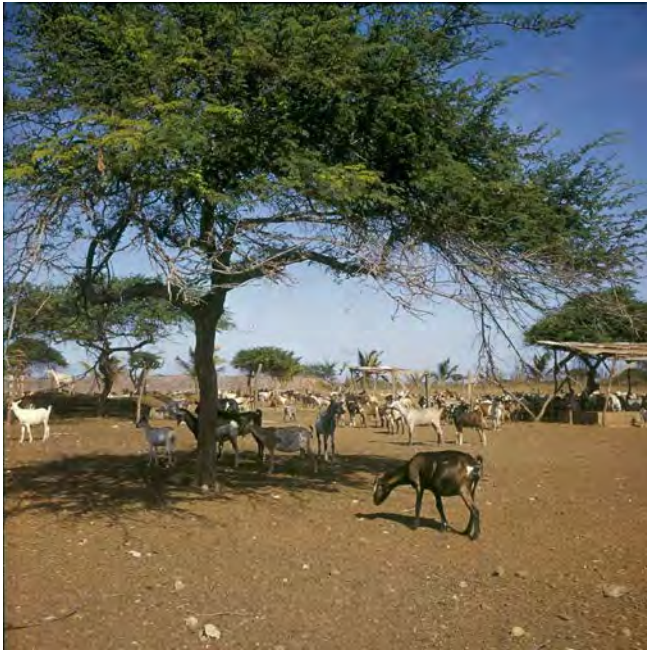
Figuur 15 Geiten in een kraal op een plantage op Aruba