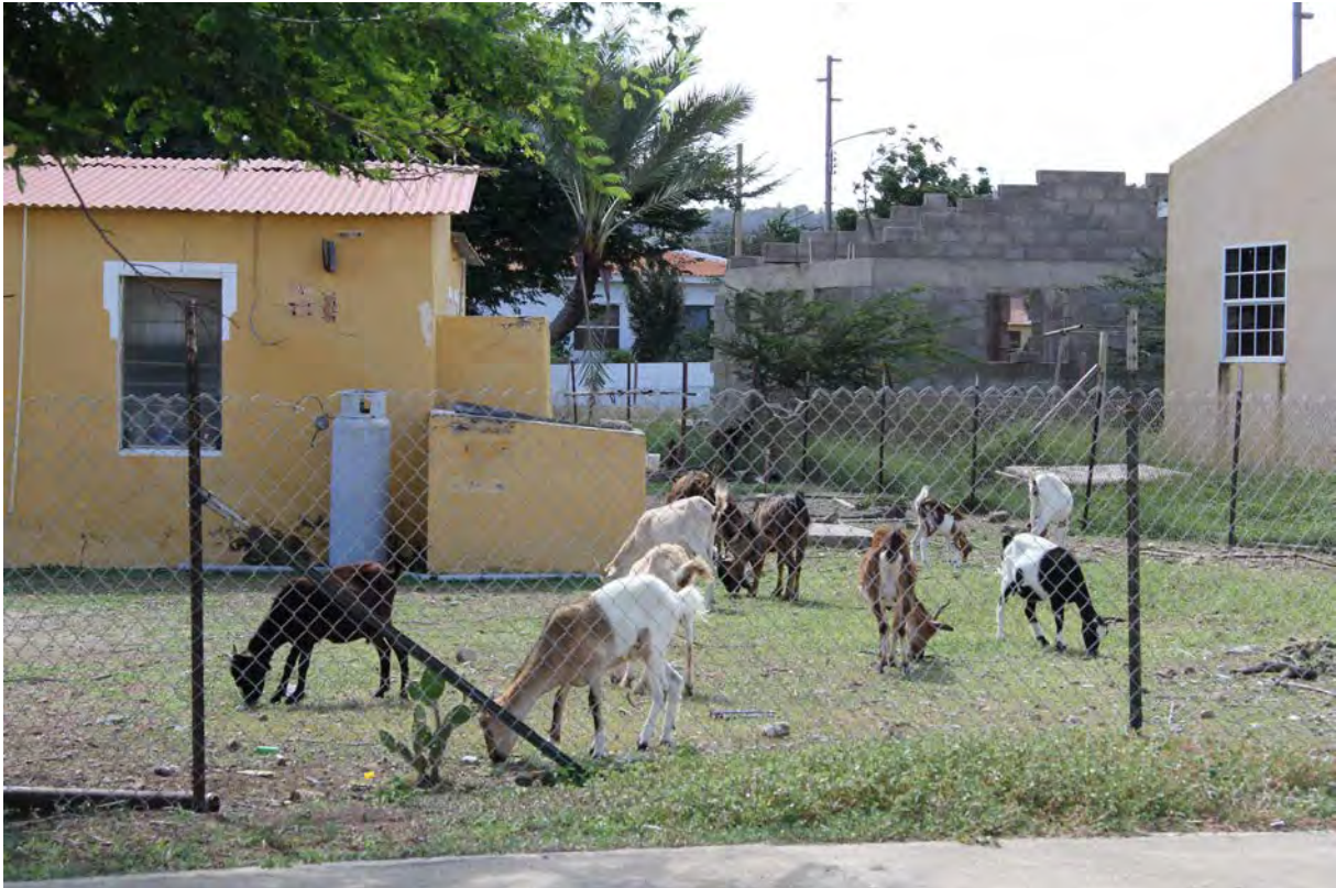
Geiten in de tuin in stedelijk gebied (niet op een transect)