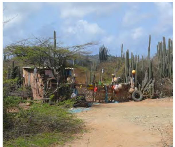
Figuur 7 Voorbeeld van een nog actief gebruikte kunuku

Loslopende geiten veroorzaken kaalslag van het eiland en een afnemende diversiteit aan planten, waardoor het waterbindend vermogen van de bodem afneemt en de bodem gevoeliger wordt voor erosie. De effecten van de ongecontroleerde begrazing van het eiland door ezels en (vooral) geiten wordt als belangrijke factor genoemd voor de afname van ook de zeldzame soorten bomen (De Freitas and Rojer 2013). Op Klein Bonaire zijn de geiten verwijderd waardoor een inventarisatie uitgevoerd in 1996 aantoont dat de vegetatie langzaam aan het herstellen is (Prins et al. 2009). Het herstel heeft zich in afgelopen jaren ook verder voortgezet (Debrot 2013).