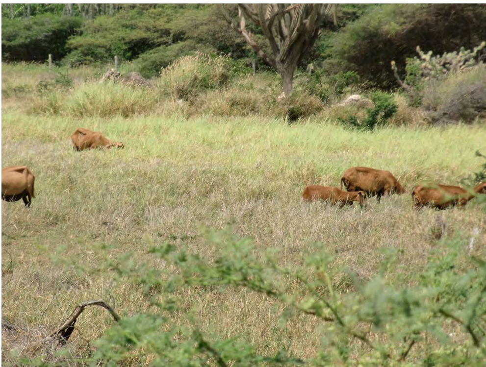
Figuur 17 Barbados black-belly ras schapen in een gecultiveerde weide op Bonaire (Debrot)