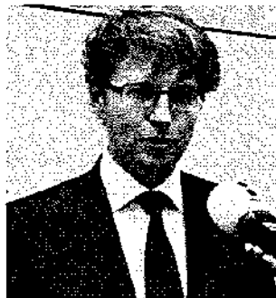
Staatssecretaris Sander Dekker

DEN HAAG - Het onderwijs op de middelbare scholen in Caribisch Nederland moet snel beter. Het afgesproken basisoniveau moet gehaald worden, de schoolbesturen moeten hun taken beter uitvoeren en het tekort aan leraren moet opgelost.