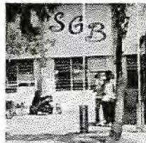
Scholengemeenschap Bonaire